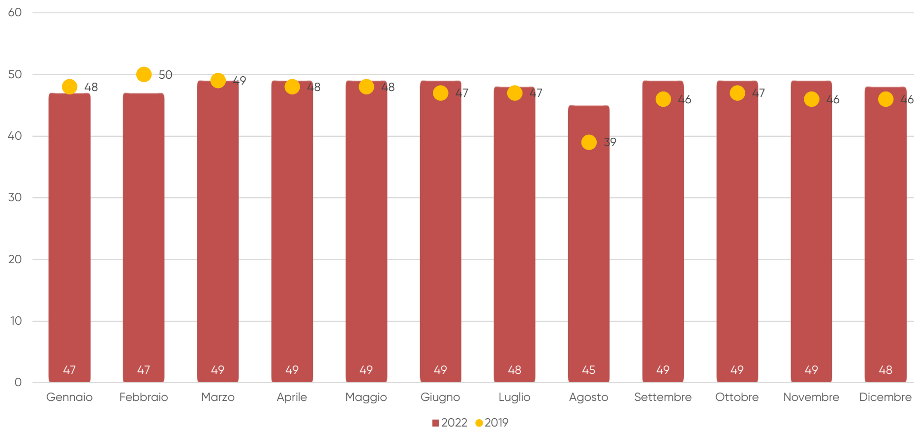
Figura 2 - Numero di musei e beni culturali del Sistema Museale Metropolitano di Torino aperti nel 2022 a confronto con il numero di beni aperti nel 2019.

Elaborazioni Osservatorio Culturale del Piemonte su dati OCP